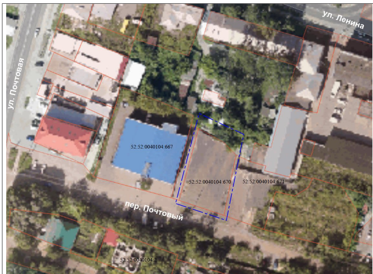
Схема границ подготовки инженерных изысканий

— — — — — граница подготовки инженерных изысканий